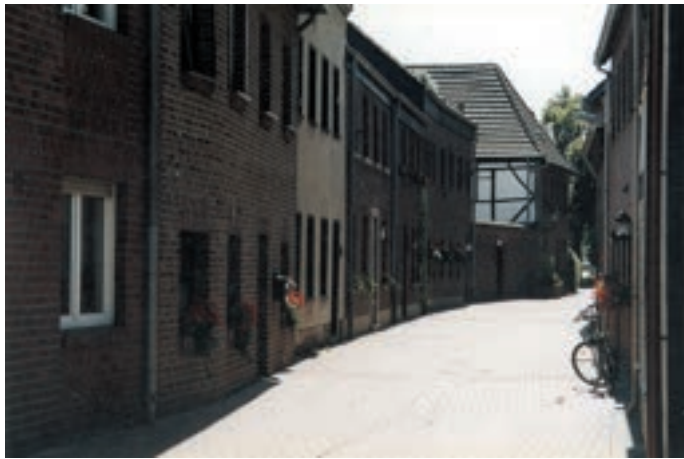
Vossenhütte, die älteste Straße in Vorst