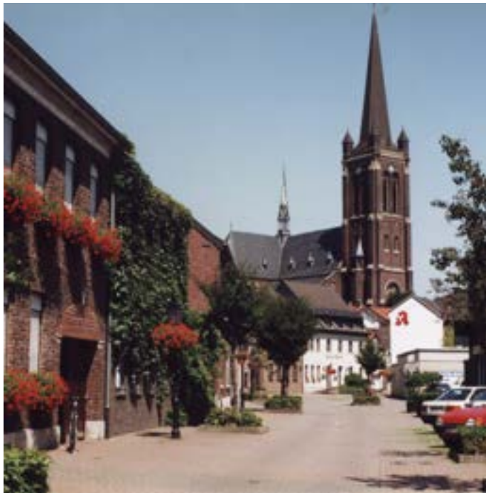
Kuhstraße in Vorst mit der Pfarrkirche St. Godehard