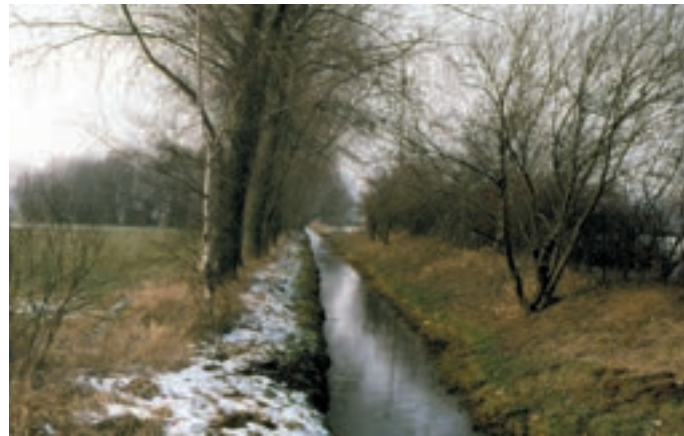
Winterstimmung im Bruchflöth

Diese Bücher können beim Heimatverein käuflich erworben werden.