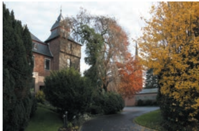
Der Herrensitz Haus Brempt in der Ortsmitte von Vorst.

Unter dem Motto „Lerne Deine Heimat kennen“ bietet der Heimatverein Vorst Tages- und Halbtagesfahrten an. So lernen unsere Teilnehmer Interessantes, wertvolle Denkmäler und Naturschätze der näheren und weiteren Umgebung kennen.