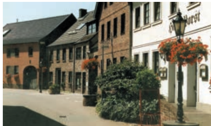
Heimathaus und Gemeindezentrum „Haus Vorst“ in der Kuhstraße